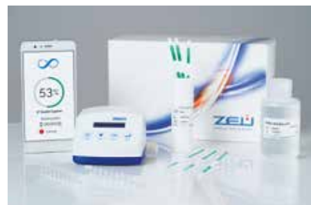
Cuantificación de leche de cabra en leche de oveja.