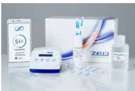
Cuantificación de leche de vaca en leche de oveja y cabra.